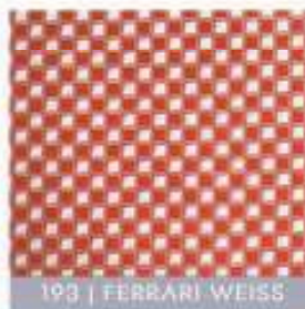
193 | FERRARI WEISS