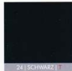
24 | SCHWARZ | T