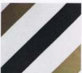
23 | BRAUN-TABAK-CAMEL