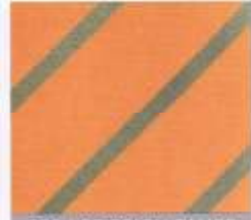
230 | PFIRSICH-TAUPE