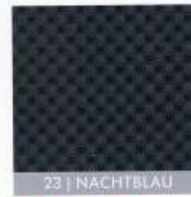
23 | NACHTBLAU