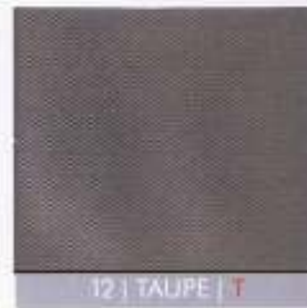
12 | TAUPE | T