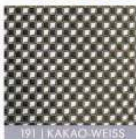
191 | KAKAO-WEISS