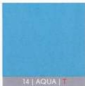
14 | AQUA | T