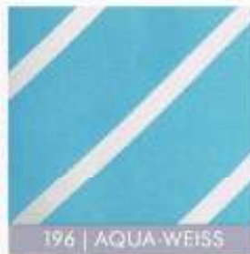
196 | AQUA-WEISS