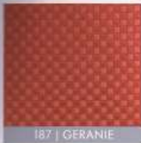
187 | GERANIE