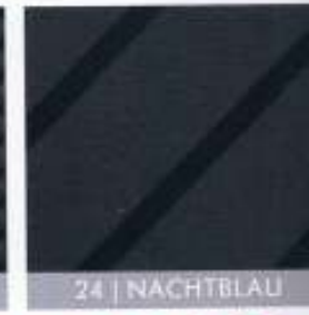
24 | NACHTBLAU