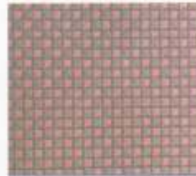
225 | TAUPE-ROSE