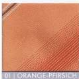
01 | ORANGE-PFIRSICH