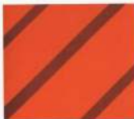
200 | PAPAYA