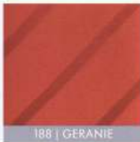
188 | GERANIE