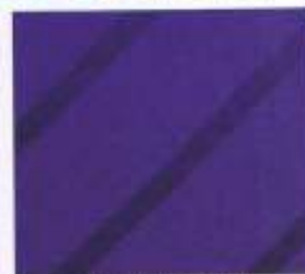
208 | VIOLETT