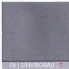
08 | SILBERGRAU | T