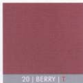
20 | BERRY | T