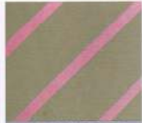
226 | TAUPE-ROSE