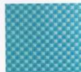
211 | OCEAN