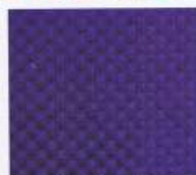
207 | VIOLETT