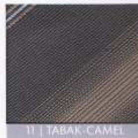
11 | TABAK-CAMEL