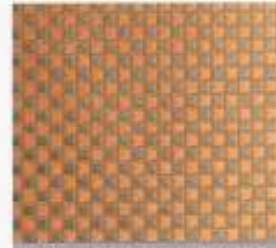
229 | PFIRSICH-TAUPE