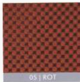
05 | ROT