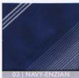
03 | NAVY-ENZIAN