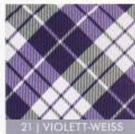
21 | VIOLETT-WEISS