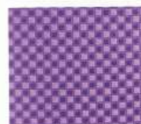
205 | HYAZINTH