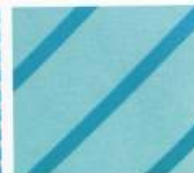
212 | OCEAN