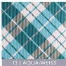
13 | AQUA-WEISS