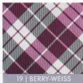
19 | BERRY-WEISS