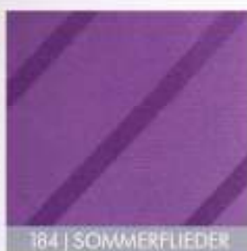
184 | SOMMERFLIEDER