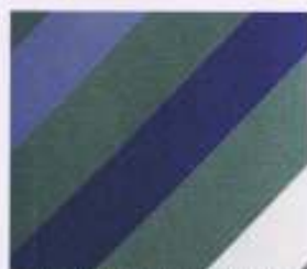
28 | VIOLETT-HYAZINTH-WEISS