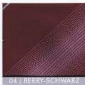
04 | BERRY-SCHWARZ