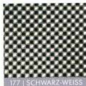
177 | SCHWARZ-WEISS