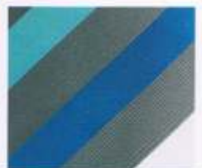
30 | PETROL-TURKIS-WEISS