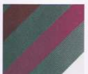
32 | CYCLAM-BERRY-WEISS