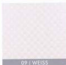
09 | WEISS