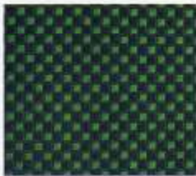
217 | NAVY-CLUBGRÜN