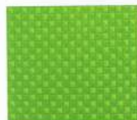
203 | GOLF