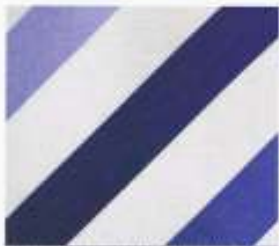
21 | VIOLETT-HYAZINTH-KROKUS