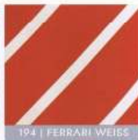
194 | FERRARI WEISS