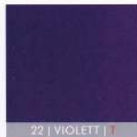
22 | VIOLETT | T