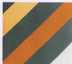
27 | MANDARIN-PFIRSICH-WEISS