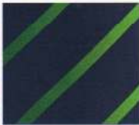
218 | NAVY-CLUBGRÜN