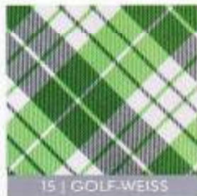
15 | GOLF-WEISS