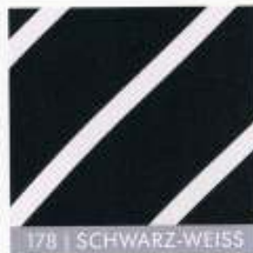
178 | SCHWARZ-WEISS