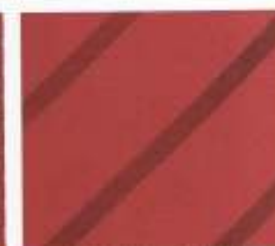
214 | HIMBEERE