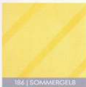
186 | SOMMERGELB