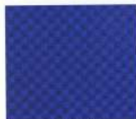
201 | ENZIAN