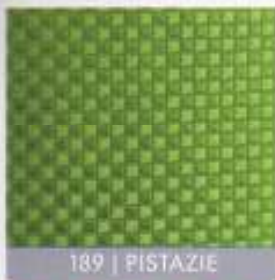
189 | PISTAZIE