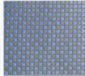
227 | BLEU-TAUPE