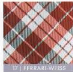
17 | FERRARI-WEISS