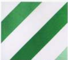
22 | GOLF-PISTAZIE-LIND