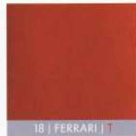
18 | FERRARI | T