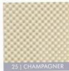
25 | CHAMPAGNER