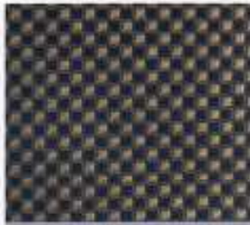
219 | NAVY-TABAK