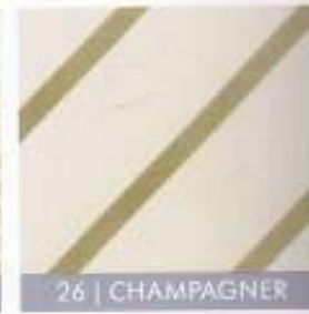
26 | CHAMPAGNER