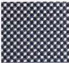
215 | NAVY-WEISS