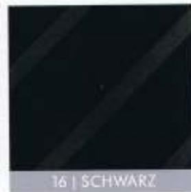
16 | SCHWARZ