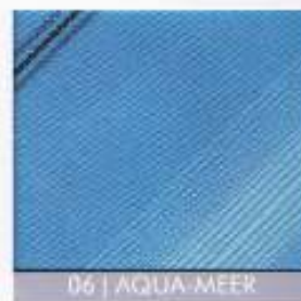
06 | AQUA-MEER