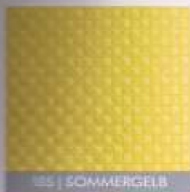
185 | SOMMERGELB