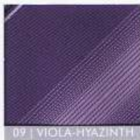
09 | VIOLA-HYAZINTH