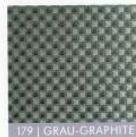
179 | GRAU-GRAPHITE