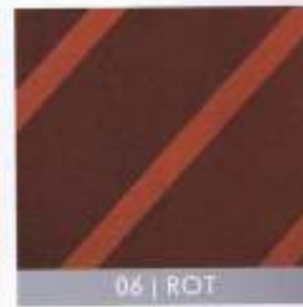
06 | ROT