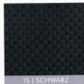
15 | SCHWARZ