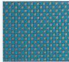
223 | TÜRKIS-TAUPE