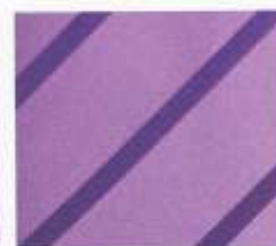
206 | HYAZINTH