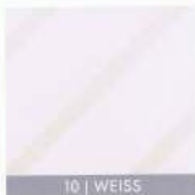
10 | WEISS