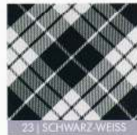
23 | SCHWARZ-WEISS