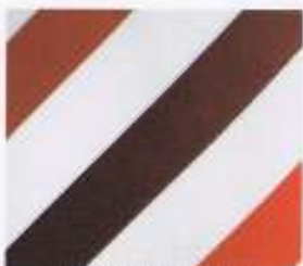
25 | BORDO-ROT-MOHN