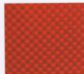
209 | HOCHROT