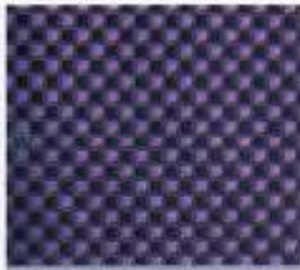
221 | NAVY-HYAZINTH