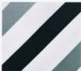
24 | SCHWARZ-GRAU-SILBER