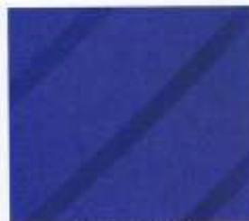
202 | ENZIAN