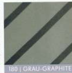
180 | GRAU-GRAPHITE