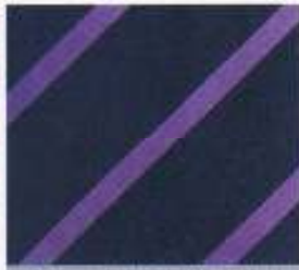
222 | NAVY-HYAZINTH