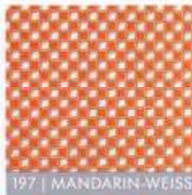
197 | MANDARIN-WEISS