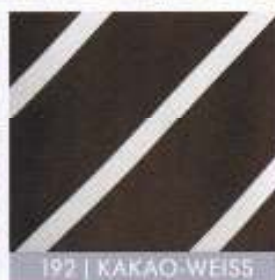
192 | KAKAO-WEISS