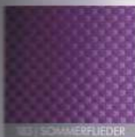
183 | SOMMERFLIEDER