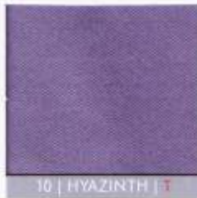
10 | HYAZINTH | T