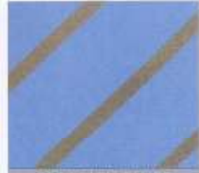
228 | BLEU-TAUPE