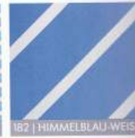
182 | HIMMELBLAU-WEISS