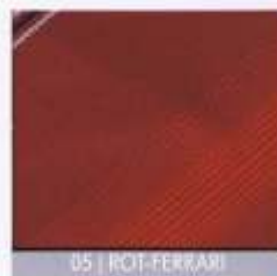
05 | ROT-FERRARI