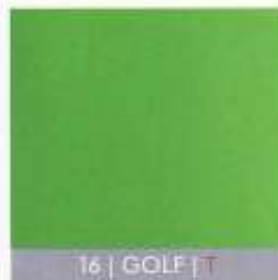
16 | GOLF | T