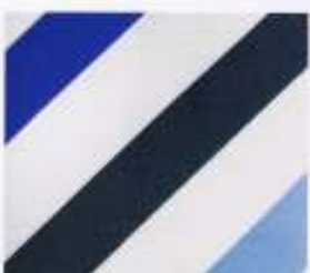
26 | NAVY-KOBALD-HIMMEL