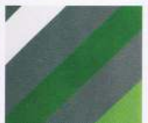
31 | CLUBGRÜN-KIWI-WEISS