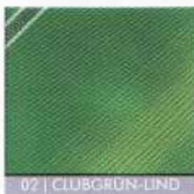
02 | CLUBGRÜN-LIND