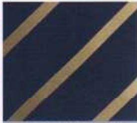
220 | NAVY-TABAK