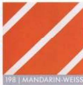
198 | MANDARIN-WEISS