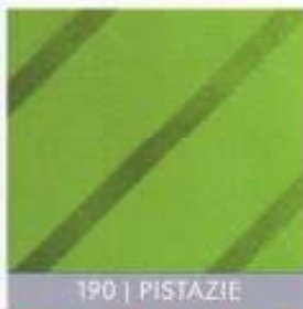
190 | PISTAZIE