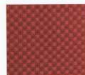
213 | HIMBEERE