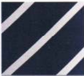
216 | NAVY-WEISS