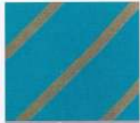
224 | TÜRKIS-TAUPE