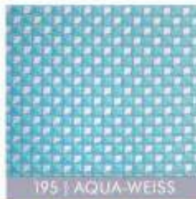
195 | AQUA-WEISS