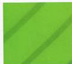
204 | GOLF