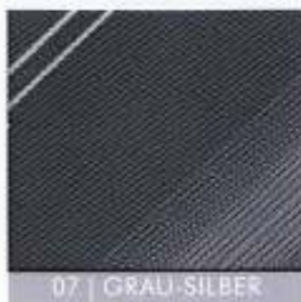
07 | GRAU-SILBER