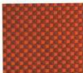
199 | PAPAYA