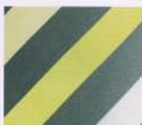
29 | ZITRONE-SORBET-WEISS