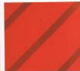
210 | HOCHROT